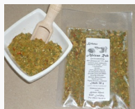
African Rub Gewürzmischung